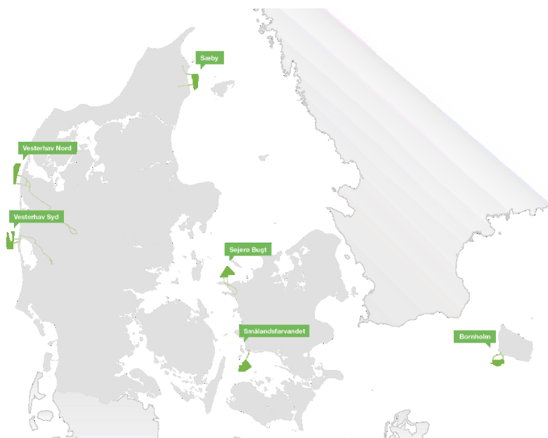
Figur 1 De 6 mulige kystnære havvindmølleparker som resultat af energiforliget

Vattenfall Vindkraft Vesterhav Syd P/S (herefter "Vattenfall") vandt udbuddet af anlæg og drift af de kommende kystnære havvindmølleparker ved Vesterhav Nord på 180 MW og Vesterhav Syd på 170 MW. Havvindmølleparkerne vil med en samlet kapacitet på 350 MW kunne producere strøm svarende til 350.000 husstandes elforbrug (se figur 1).