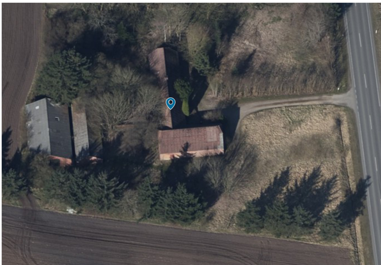
Billede 4 Ejendommen set mod vest