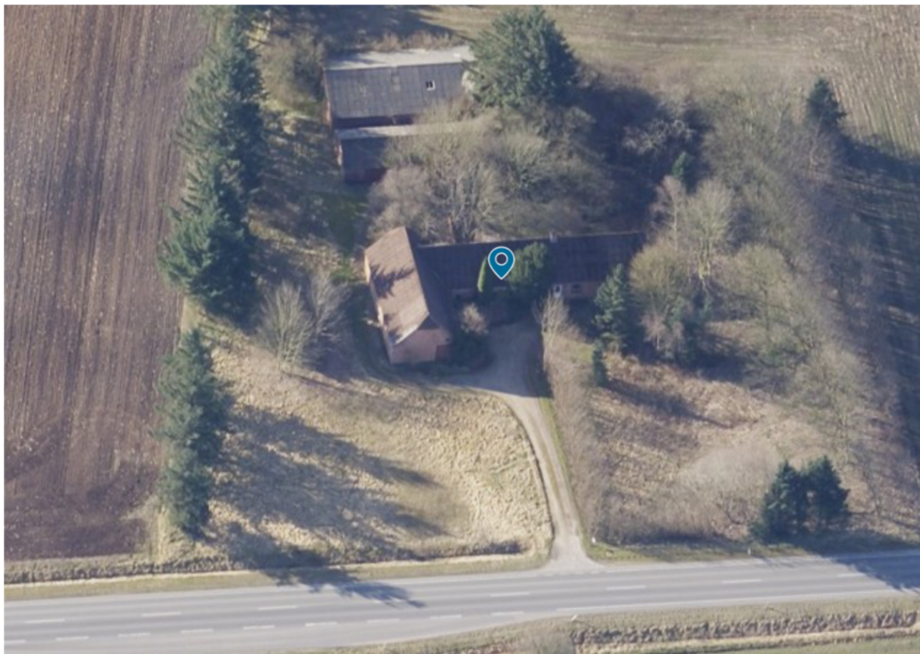
Billede 3 Ejendommen set mod syd