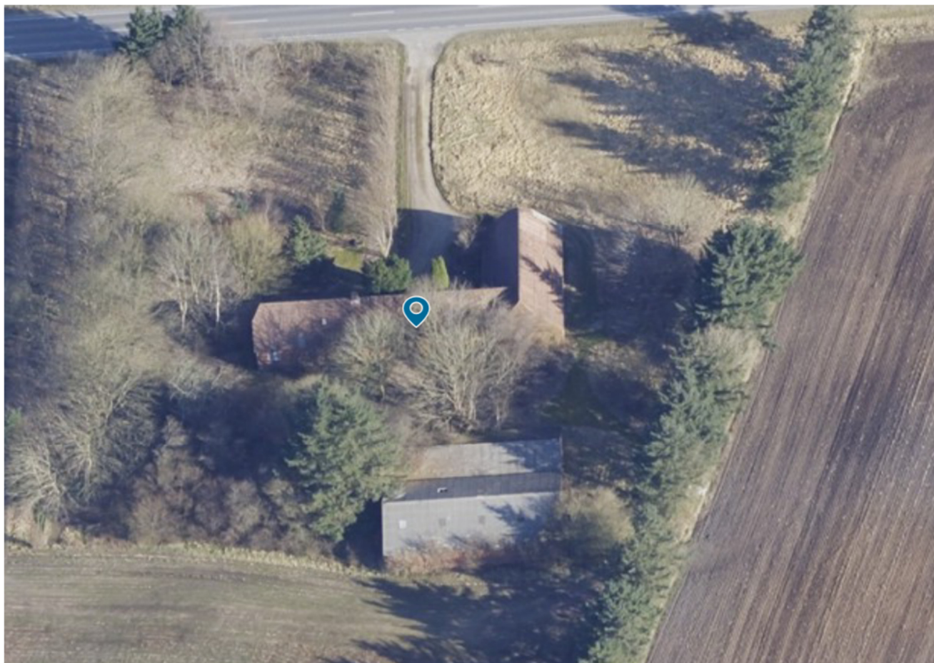
Billede 1 Ejendommen set mod nord